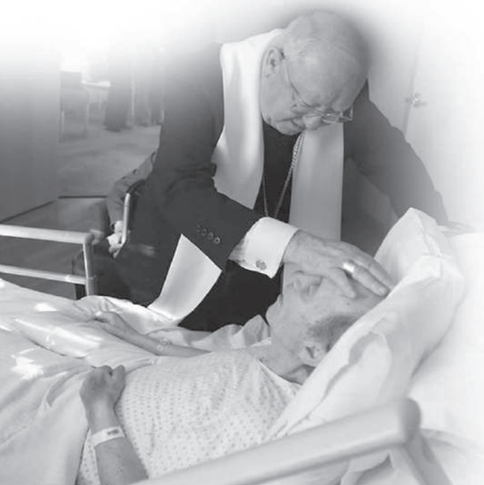
നിന്റെ തെദവവും കർത്താവുമാളു ഞാൻ നിന്റെ വലത്തുതൈ പിടിച്ചിരിക്കുന്നു. ഞാനാണു പറയുന്നത്. ഭേദമില്ലാത്ത. ഞാൻ നിന്നെ സ്നഹിക്കുന്നു.

മാമ്മോദീസ, സൈമര്യലേപനം, ദിവ്യകാരുണ്യം എന്നീ കുദാശകൾ, “ക്രൈസ്തവ പ്രാരംഭത്തിന്റെ കുദാശകൾ” എന്ന പേരിൽ ഐക്യപ്പെട്ടിരിക്കുന്നതുപോലെ തന്നെ, അനുതാപകുദാശ, രോഗീലേപനം, തിരുപ്പാമേയമായ ദിവ്യകാരുണ്യം എന്നിവ ക്രൈസ്തവ ജീവിതത്തിന്റെ അന്ത്യത്തിൽ “സ്വർഗീയ പിതൃഭവനത്തിലേക്ക് ഒരുക്കുന്ന കുദാശകൾ” അഥവാ ഭൗമിക തീർത്ഥാടനത്തെ പൂർത്തിയാക്കുന്ന കുദാശകൾ എന്ന നിലയിൽ ഐക്യപ്പെട്ടിരിക്കുന്നു. (CCC 1525).